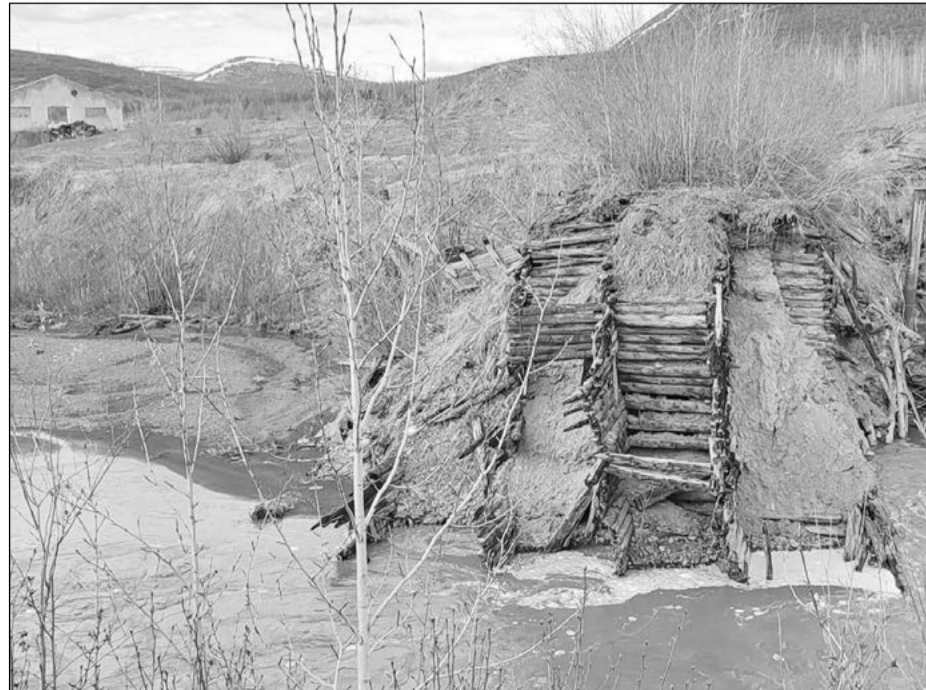
Вид на остатки плотины Ларюковской ГЭС.

...Есть сведения, что при утверждении проекта не-