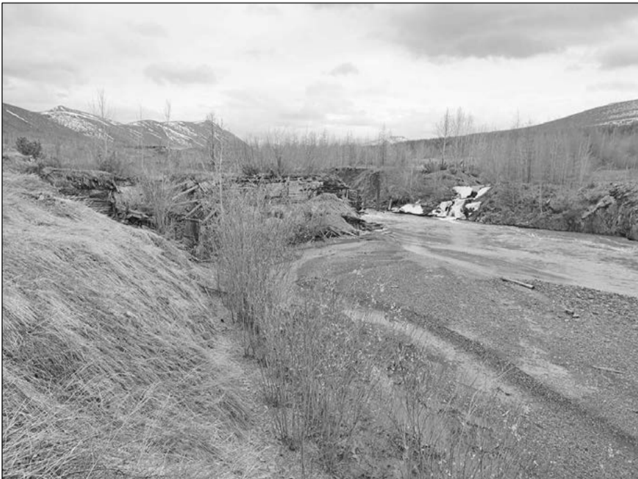
Общий вид на остатки Ларюковской ГЭС и устье ручья Лабораторный, май 2023 года.

наблюдается холодок, рабочий день не уплотнен, люди часто непроизводительно используют свой рабочий день».