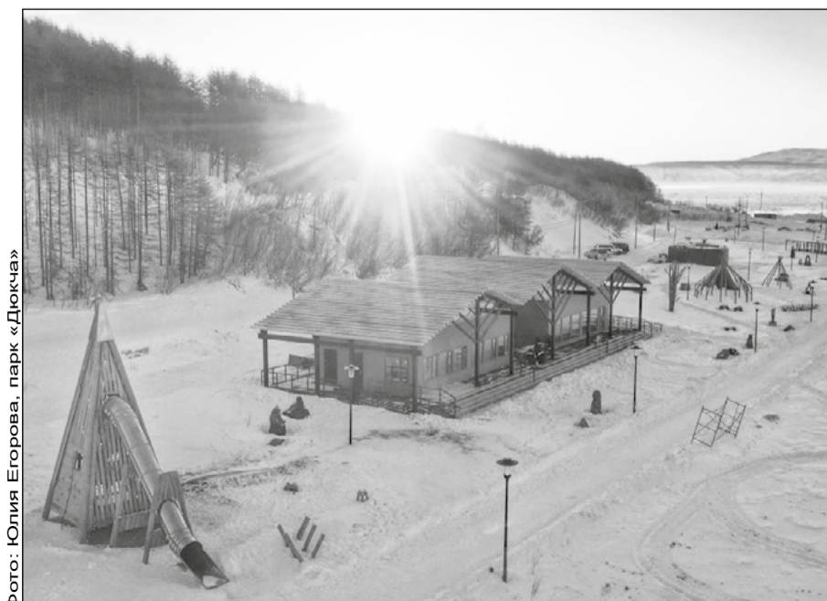
парк «Дюкча»