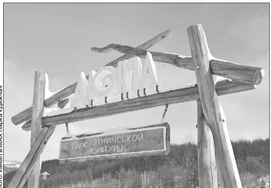
Фото: канал в МАХ парка «Дюкча»