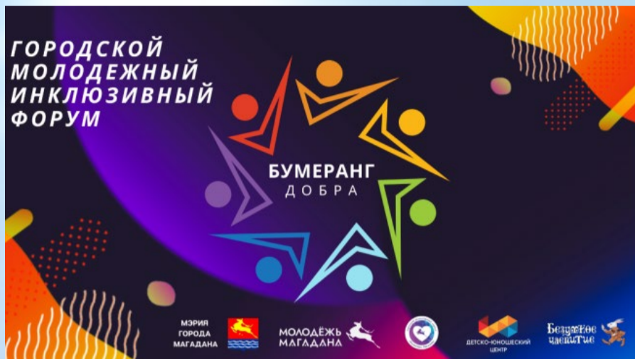
В Магадане проведут Городской молодежный инклюзивный форум «Бумеранг добра» (12+)