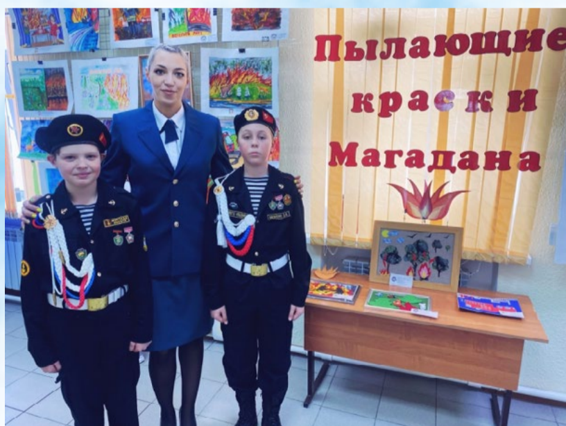
О пожарной безопасности в рисунках: в Магадане прошла выставка детских работ