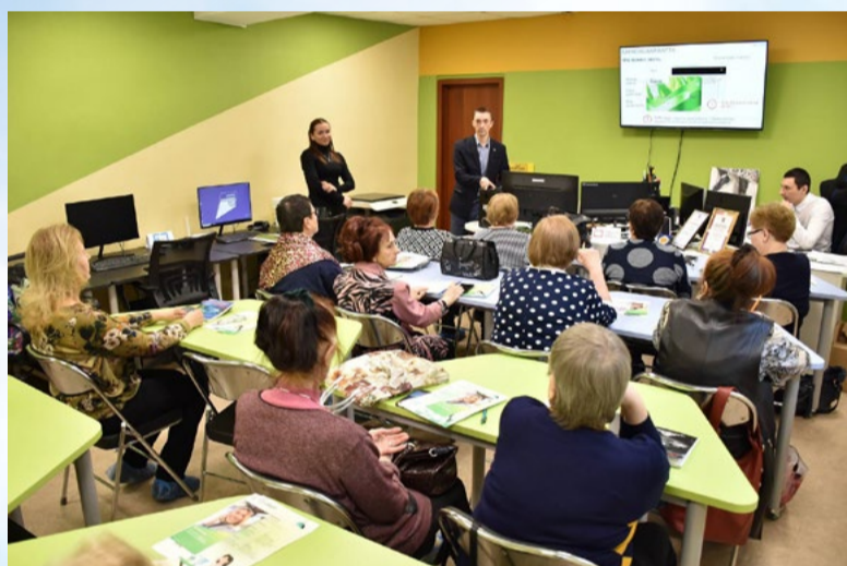
В Центральной городской библиотеке им. О. Кузеева прошло мероприятие «Со смартфоном на «Ты!» (18+)