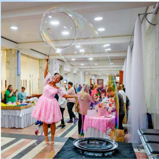
«Нити добра»: благотворительная ярмарка и концерт прошли в Центре культуры