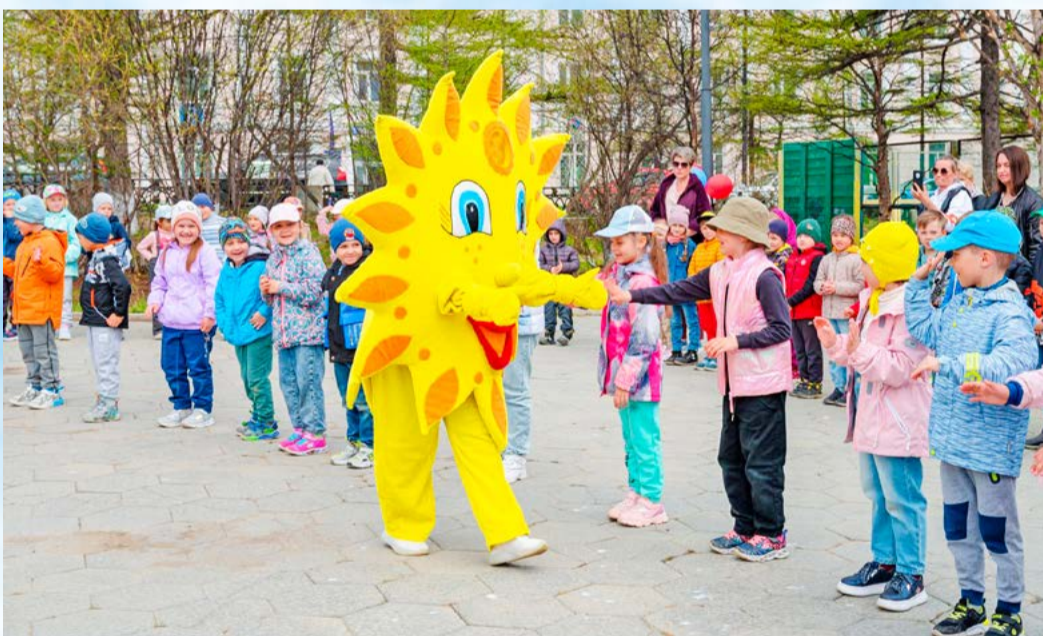
Флешмоб, посвященный Дню защиты детей, прошел в сквере «70 лет Магадану»