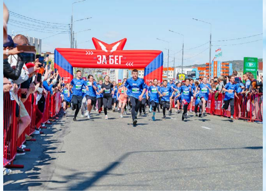
«Забег.РФ» прошел в Магадане