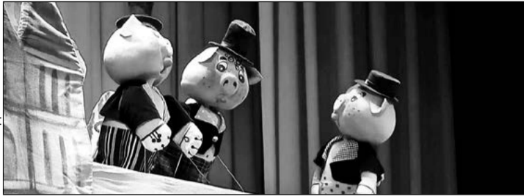
Фото: Магаданский областной театр кукол

При поддержке партпроекта театру удалось не только улучшить свою материально-техническую базу, но и творчески совершенствоваться.