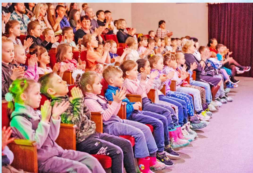
Более 50 праздничных мероприятий, посвященных Дню защиты детей и открытию летнего сезона, пройдут в первые дни июня (0+)