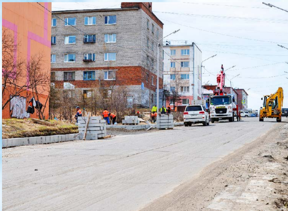
Юрий Гришан: Если мы делаем дорогу, то все коммуникации также необходимо обновить