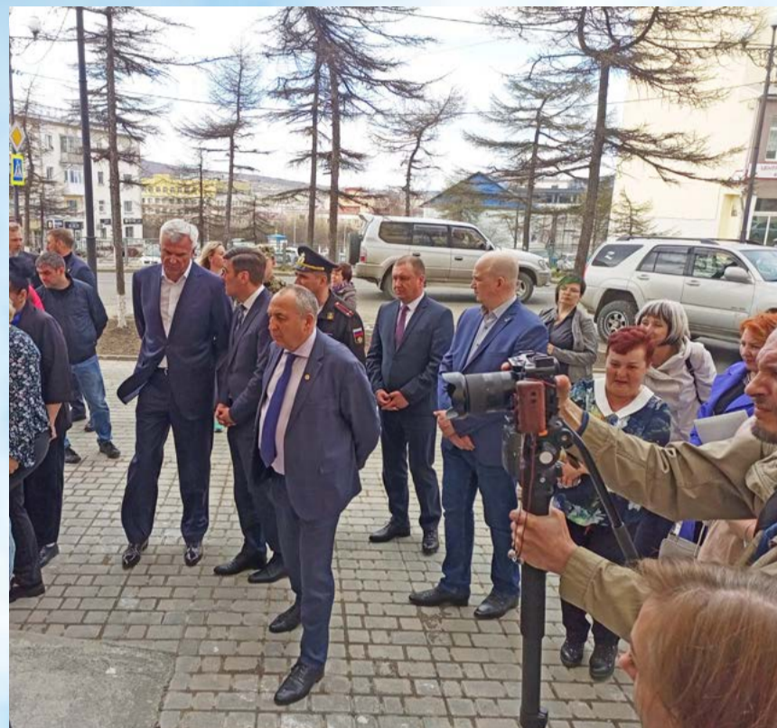
На Колыме открыли региональный филиал фонда «Защитники Отечества»