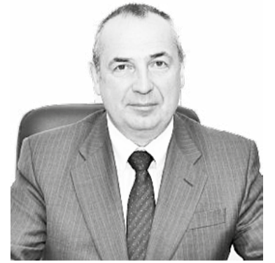
Глава МО «Город Магадан», мэр города Магадана Юрий ГРИШАН

В День защиты детей желаю каждому ребенку иметь крепкую семью и все необходимое для безопасного детства. Пусть наш Магадан сияет детскими улыбками, и каждый его маленький житель растет здоровым и счастливым!