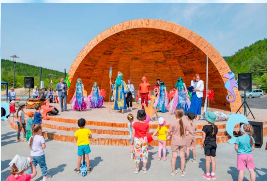
День рыбака встретили в этнопарке «Дюкча»