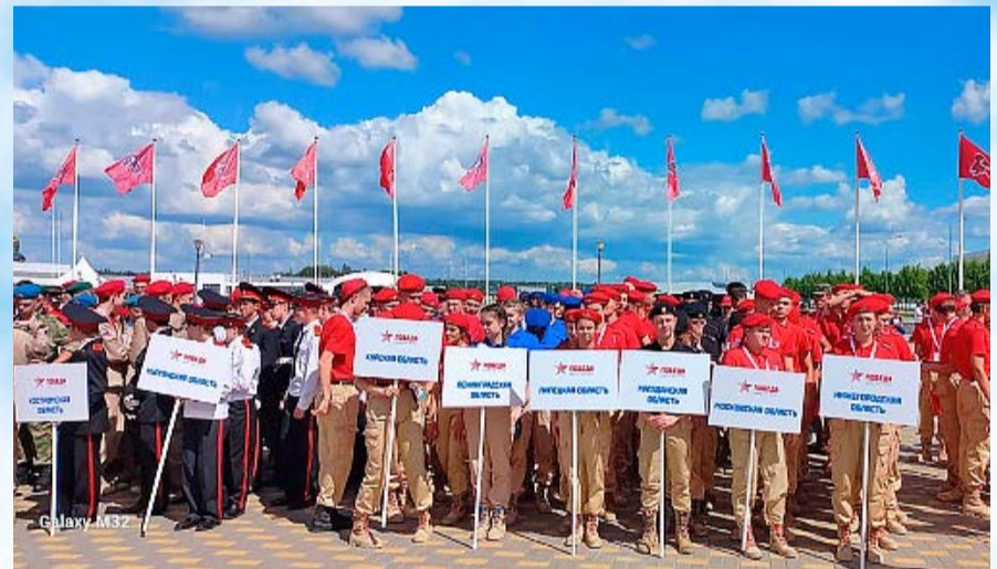
Магаданский военно-технический центр «Подвиг» принял участие в финале юнармейской военно-спортивной игры «Победа»