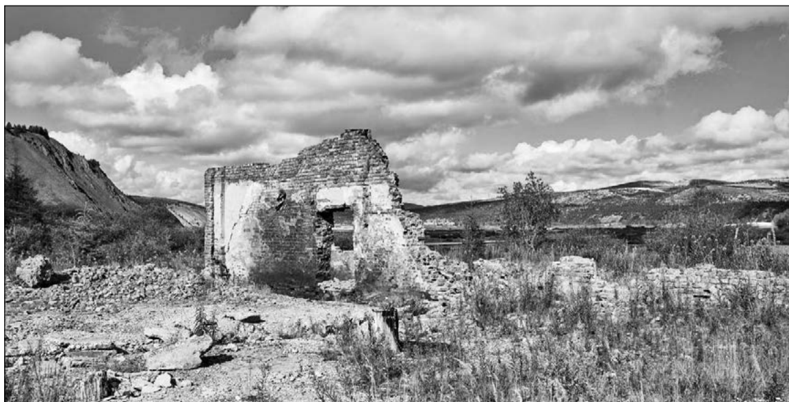
Развалины электростанции. Хета. Июль 2016 года.