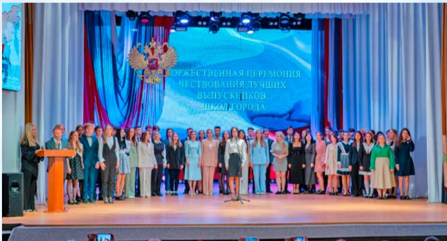
В Магадане прошла торжественная церемония вручения медалей «За особые успехи в учении» выпускникам школ города