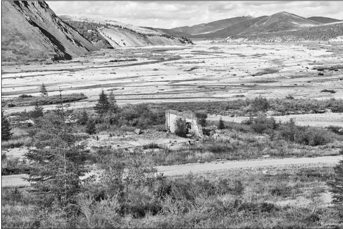
Долина реки Правая Хета. На переднем плане — остатки от здания Хетинской ДЭС. Июль 2016 года.

Если говорить о становлении и развитии энергетического комплекса Хетинской долины, то начать стоит с самой первой передвижной электростанции, которую выделило руководство ЮГПУ новому прииску «Хета» весной 1940 года. Электростанция работала на жидком топливе.