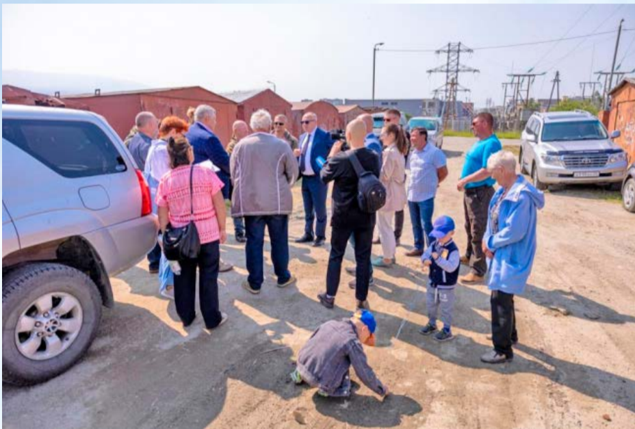
Мэр Магадана Юрий Гришан по результатам приема горожан по личным вопросам встретился с собственниками гаражного кооператива на Шандора Шимича, 6/1