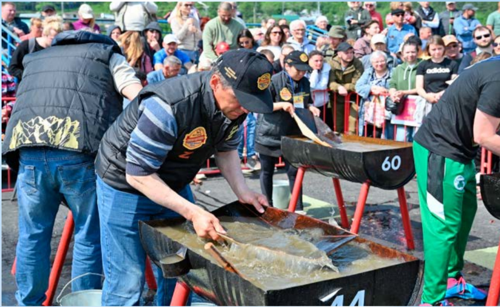
VII «Золотой фестиваль» (18+) в Магаданской области пройдет 29 июля на территории этнического парка «Дюкча»