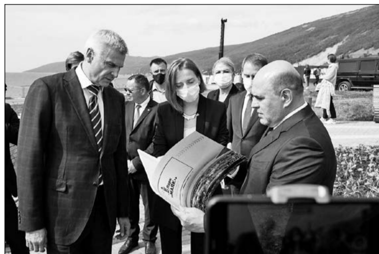
Глава правительства РФ Михаил Мишустин и губернатор магаданской области Сергей Носов в парке «Маяк», 2020 год

Парк «Маяк» – флагманский, но далеко не единственный проект в Магаданской области, направленный на создание комфортной среды. Достаивается очередная очередь парка «Дюкча» на берегу бухты Гертнера. 100 миллионов рублей направлены на реализацию второй очереди городского парка в Сусумане. По национальному проекту «Жилье и городская среда», проектам «Фор-