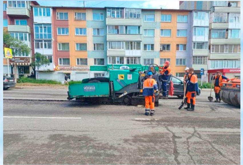
Специалисты ГЭЛУД продолжают ямочный ремонт улично-дорожной сети Магадана