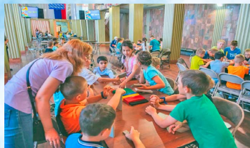
Центр культуры завершил череду июльских мероприятий креативной игрой для детей