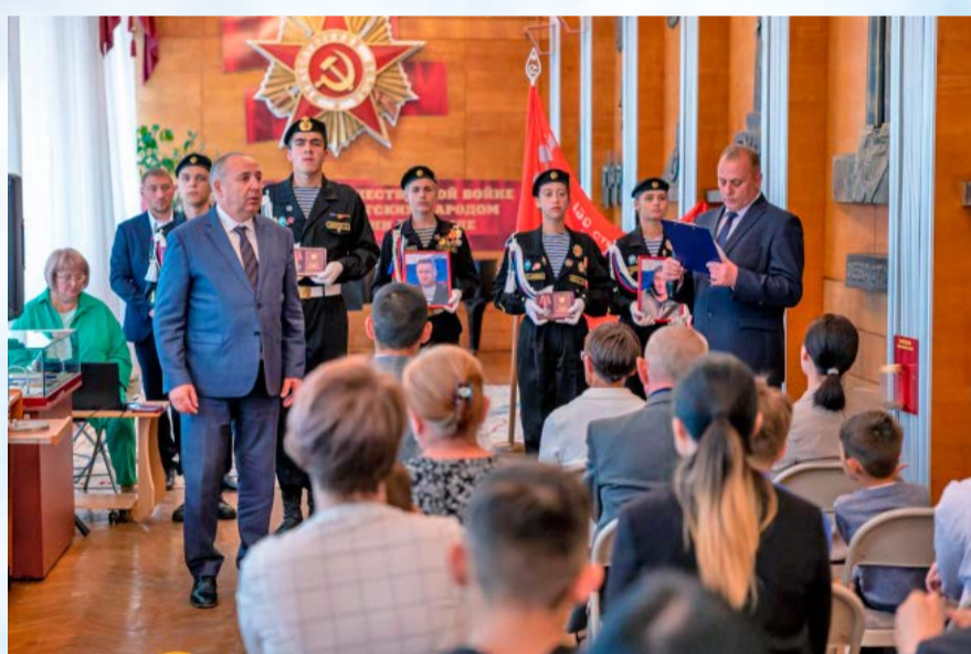
В Галерее Боевой Славы вручили награды семьям бойцов, погибших при исполнении воинского долга