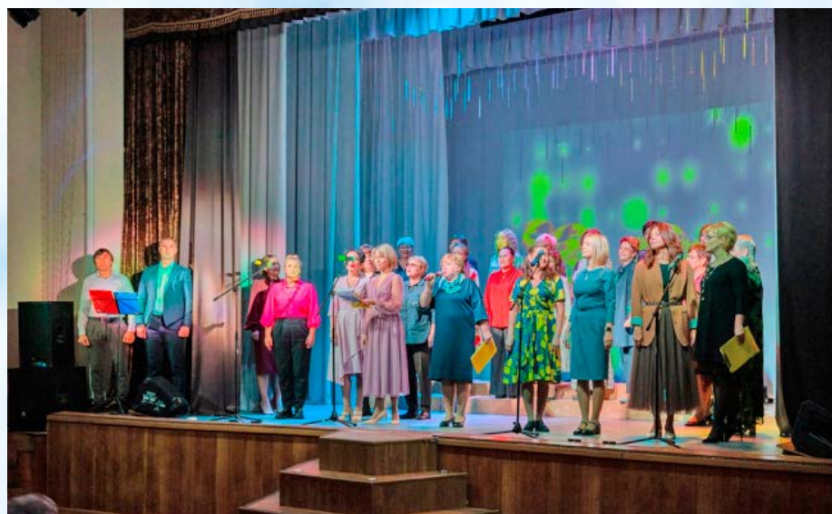
Магаданская школа № 20 отметила свой 60-летний юбилей