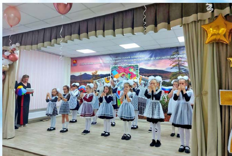
Отпраздновал свой 70-летний юбилей коллектив начальной школы-детского сада № 9 в микрорайоне Снежный