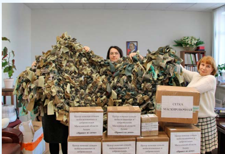
Центр поддержки семей мобилизованных продолжает работать в Магадане