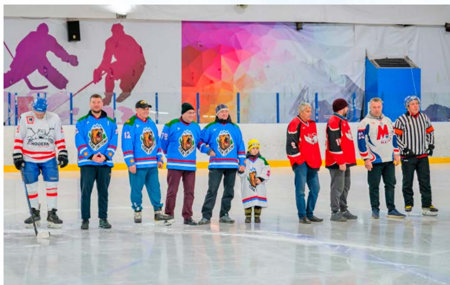
В областном центре продолжаются ежегодные спортивные соревнования «Кубок мэра Магадана по хоккею с шайбой» (12+)