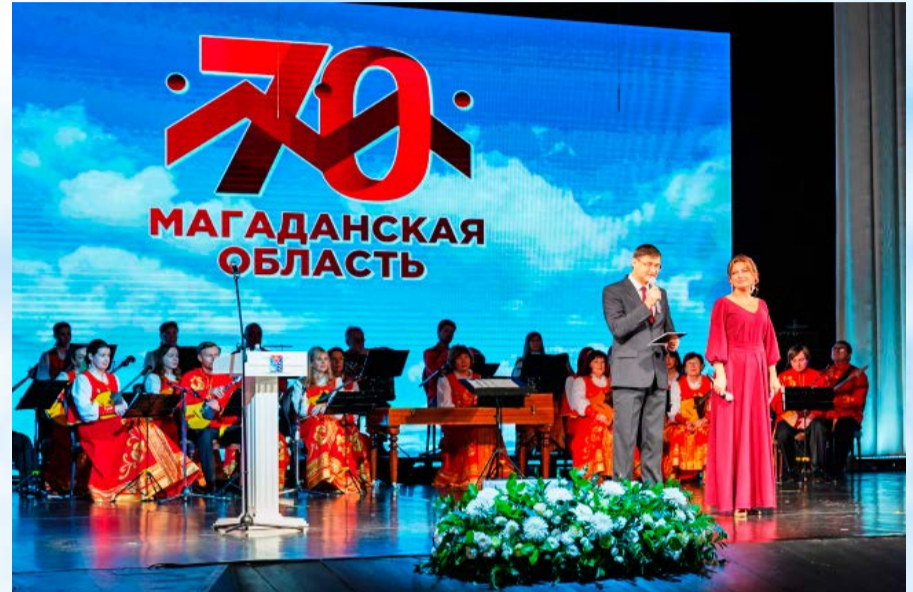
Торжественный концерт (16+), посвященный 70-летию Магаданской области, прошел в Магаданском музыкальном и драматическом театре