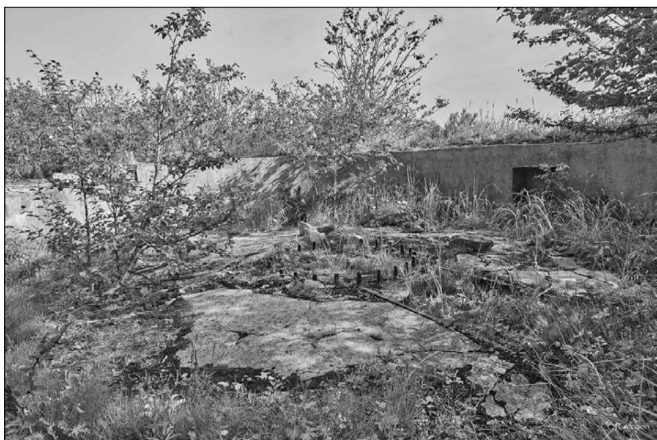
Крепления орудийной установки. 2023 год.