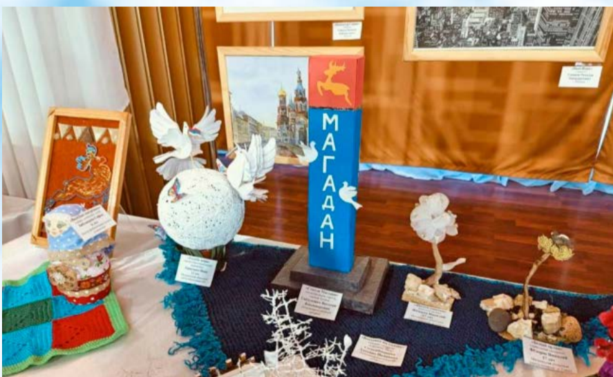
В Центре культуры города Магадана открылась региональная выставка изобразительного и декоративно-прикладного творчества людей с ограниченными возможностями «Душа всегда свободна» (6+)