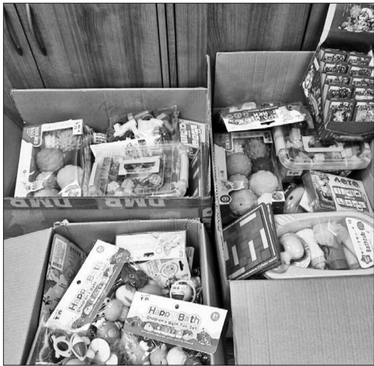
Сторонники регионального отделения «Единой России» и волонтеры Центра помощи семьям мобилизо-

ванных принесли «Коробку храбрости» (12+) в центр охраны материнства и детства.