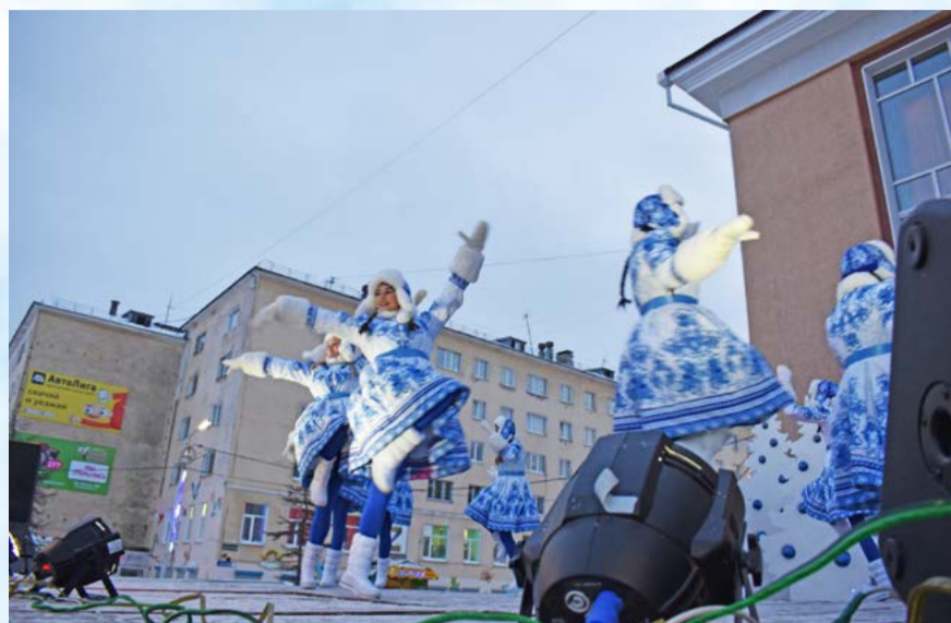
А на сцене Театральной площади собравшихся ждала праздничная программа