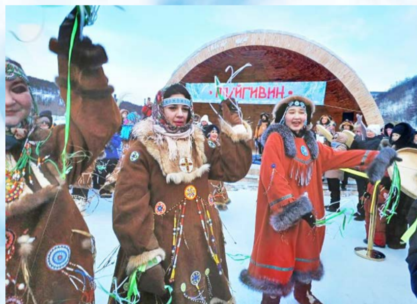
Корякский Новый год Туйгвин (6+) отметили в Магадане