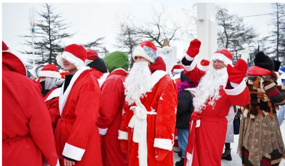
Парад Дедов Морозов в 2024 год стартовал от входа в Городской парк