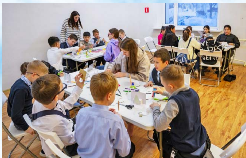
Глава города Юрий Гришан провел выездное совещание в новом Центре дополнительного образования «Юника»