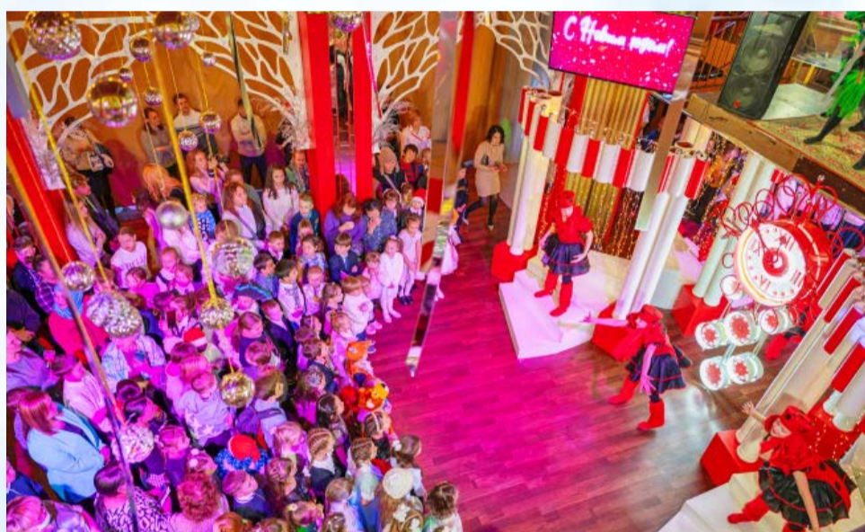
В Центре культуры Магадана стартовали традиционные елки мэра (0+)