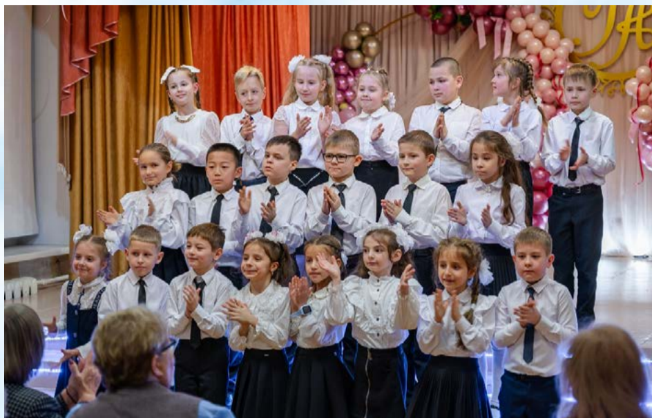
Учащиеся английской гимназии