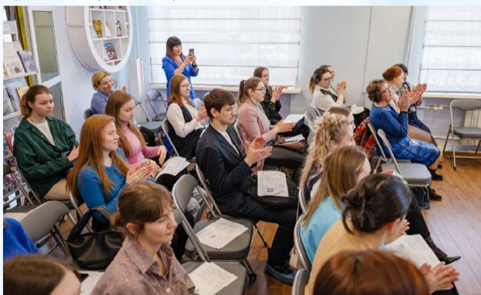
Вместе, но не вместо: В Магадане семинар молодых педагогов открыл Год семьи (18+)