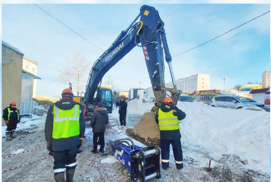
Надежность и увеличение пропускной способности – в Автоэке реализуют крупный проект по строительству сетей водоснабжения