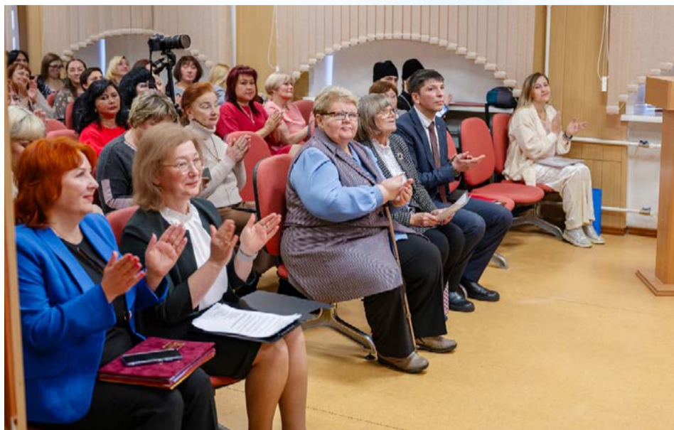
Английская гимназия принимает поздравления. Одному из ведущих образовательных учреждений города исполнилось 30 лет