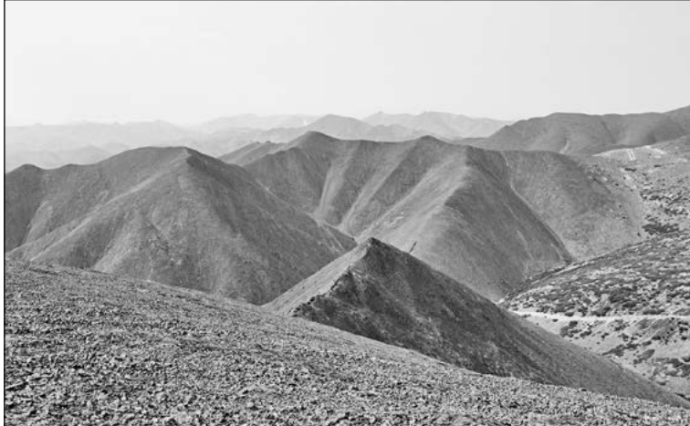
В горах Урчана. 2019 год

Во время очередной экспедиции удалось плодотворно поработать в архиве Магаданской области (ГАМО). Изучая материалы по руднику «Урчан» открыл для себя много нового, о чем порой не подозревал и не задумывался.