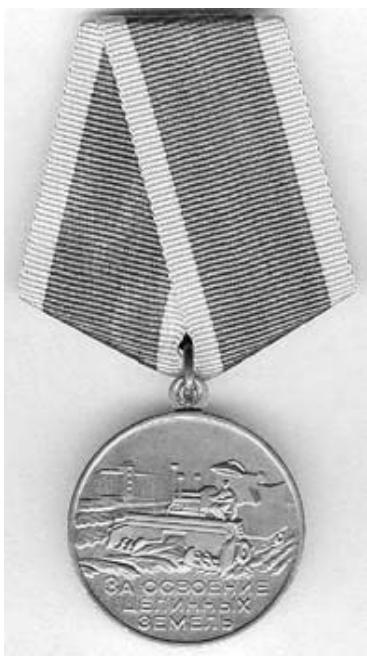
Медаль «За освоение целинных земель»