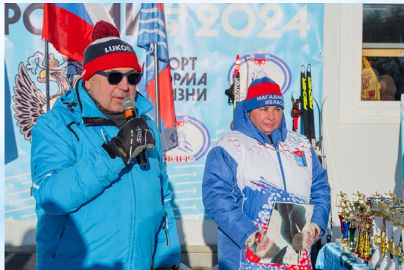
В Магадане прошла Всероссийская гонка «Лыжня России» (6+)