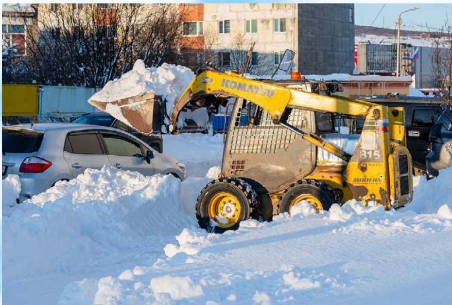
Коммунальные службы города чистят областной центр от снега