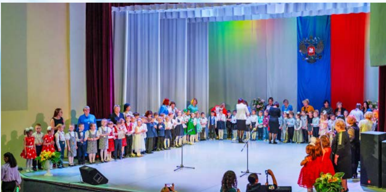
Во Дворце детского (юношеского) творчества торжественно закрыли XXV олимпиаду дошкольников «Умники и умницы» (6+)