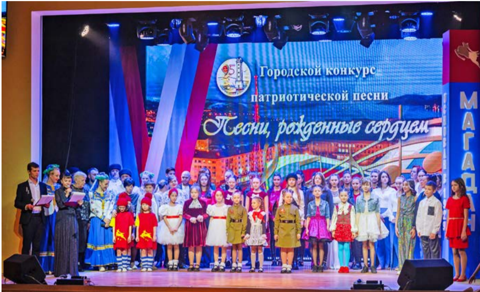
Итоги городского конкурса «Песни, рожденные сердцем» (6+) подвели в Магадане