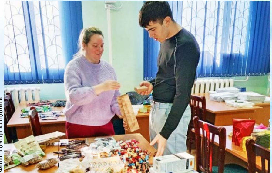
Курсанты центра «Подвиг» отправят 49 сладких наборов раненым бойцам, которые находятся на лечении в госпиталях Приморья