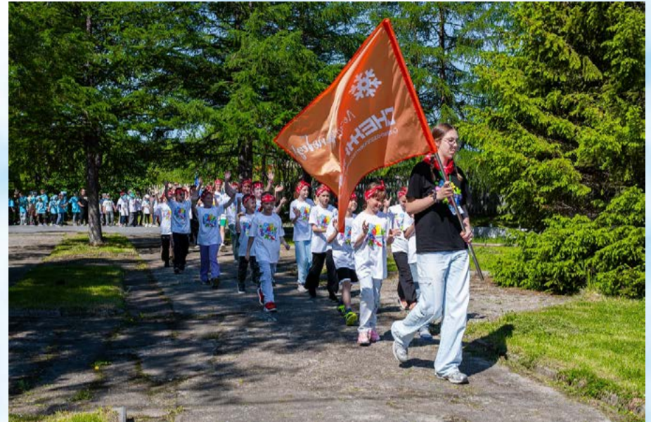
В Магадане продолжается летняя оздоровительная кампания: СОК «Снежный» встречает вторую смену (6+)