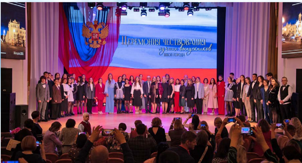
Медали за «Особые успехи в учении» I и II степени получил 61 выпускник магаданских школ (12+)