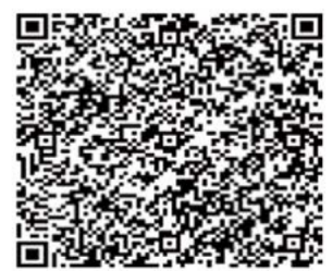
для оплаты через приложение банка

Назначение платежа: Благотворительный взнос