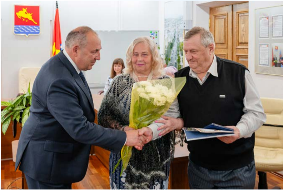
В Магадане 19 семей получили медали «За любовь и верность» (16+)