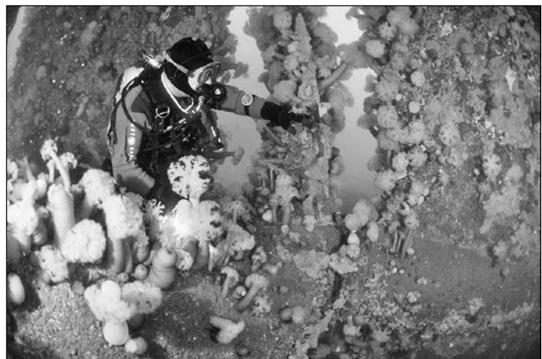
На пароходе «Выборг».