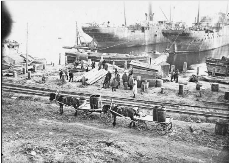
Базовые суда Тихоокеанской экспедиции ЭПРОН пароходы «Индирикка» и «Днепр» с портом приписки Владивосток. 1932-1936 годы.

В результате взрывов 19 декабря 1947 года в бухте Нагаева были затоплены пароходы «Генерал Ватутин» и «Выборг», получили значительные повреждения как сам морской торговый порт, так и суда, пришвартованные к пирсам. Оказались разрушенными или поврежденными поселки Березовый мыс, Березовая роща и Нагаево (включая предприятия, находившиеся там).