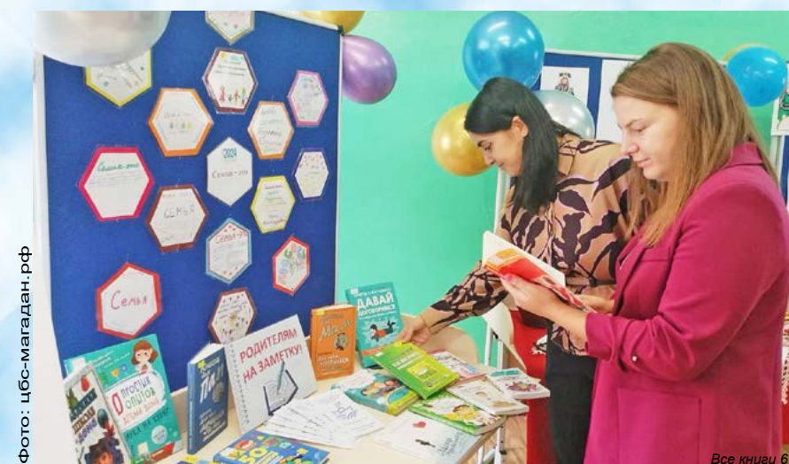
Сотрудники библиотеки № 5 приняли участие в профессиональной экскурсии для молодых педагогов в формате «педагогического туризма» (16+)