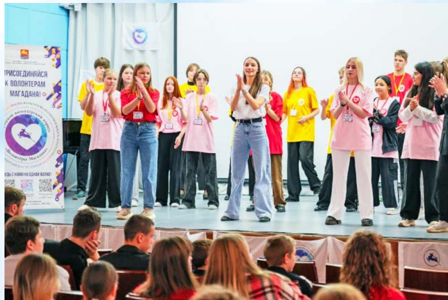
В Магадане вот уже в четвертый раз прошел Городской волонтерский форум (16+)