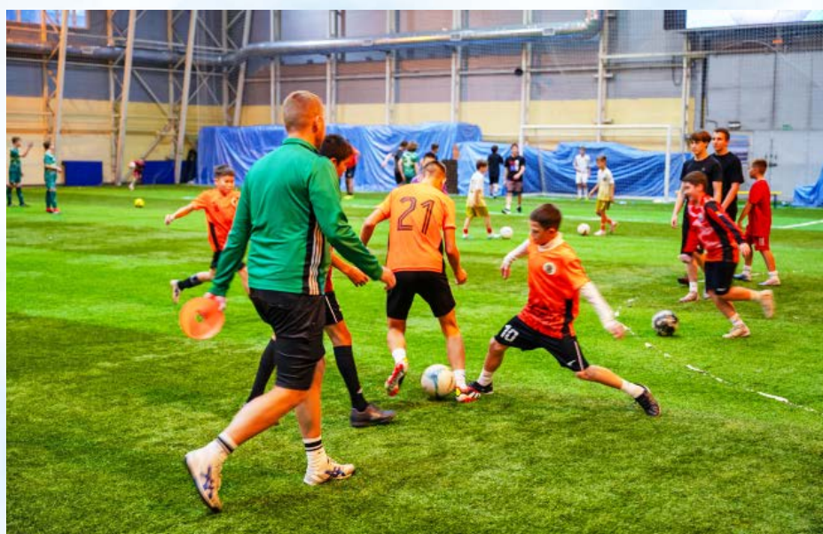
В областном центре завершился ежегодный традиционный городской детско-юношеский турнир по мини-футболу «Кожаный мяч» (6+)