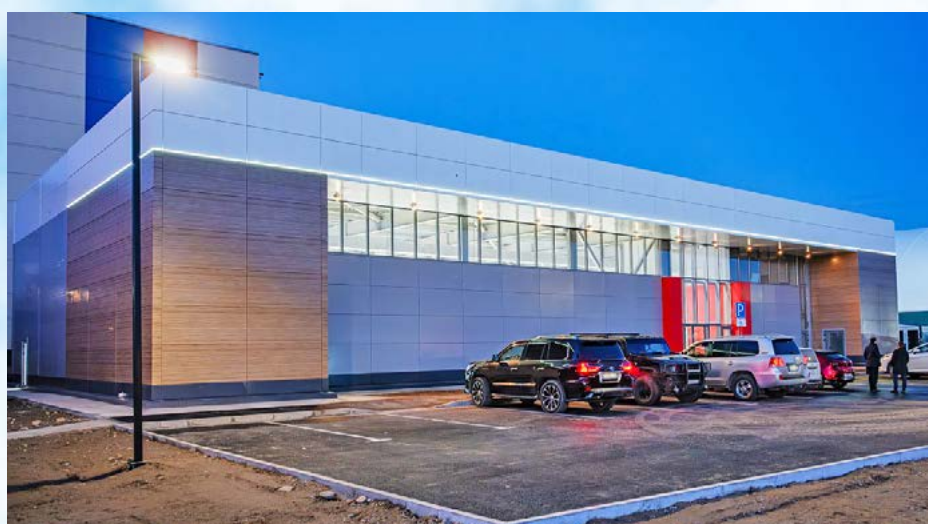
Новое бизнес-пространство украсило центральную часть Магадана