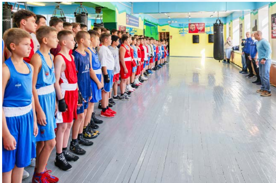
В областном центре прошел двухдневный городской турнир по боксу (12+)