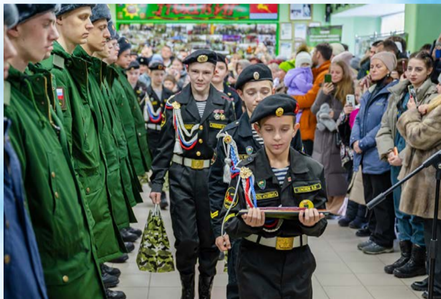
Новая группа срочников отправилась из Магадана в Вооруженные силы РФ