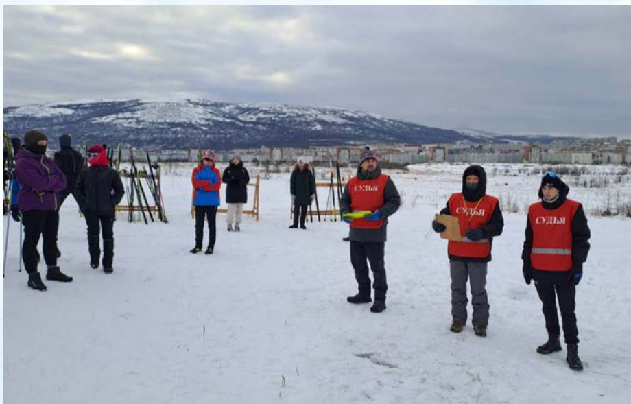
Прошли Областные лично-командные соревнования Кубок Магаданской области (12+)