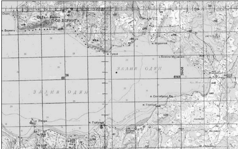
Залив Одян, бухта Мелководная.