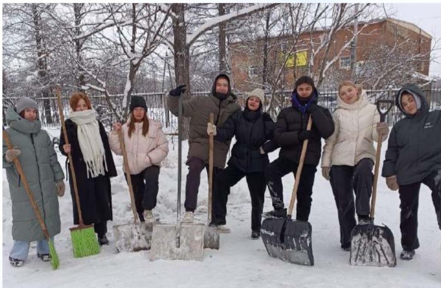
Воспитанники школы № 20 вышли на уборку территории вокруг своего учреждения