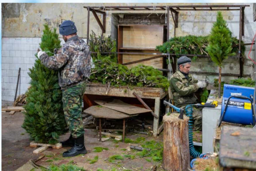
Горлесхоз приступил к изготовлению новогодних елок