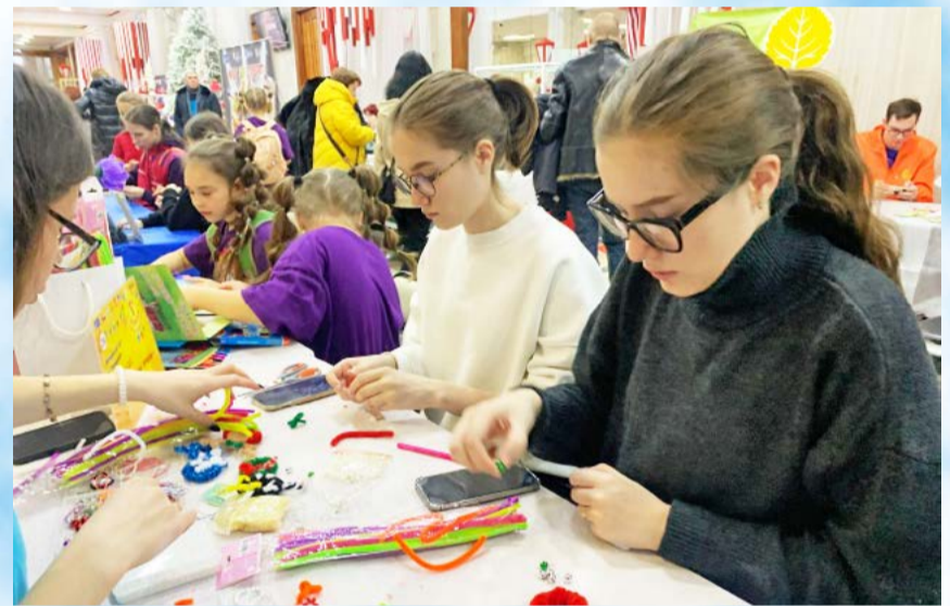
В муниципальном Центре культуры в минувшую субботу состоялась V Ярмарка досуга и творчества (6+)