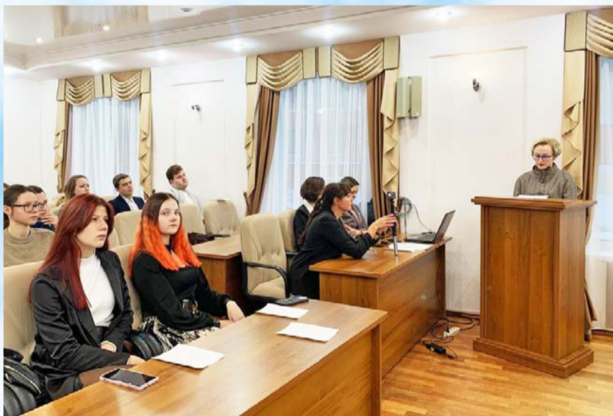
В мэрии областного центра прошло заседание Координационного молодежного совета