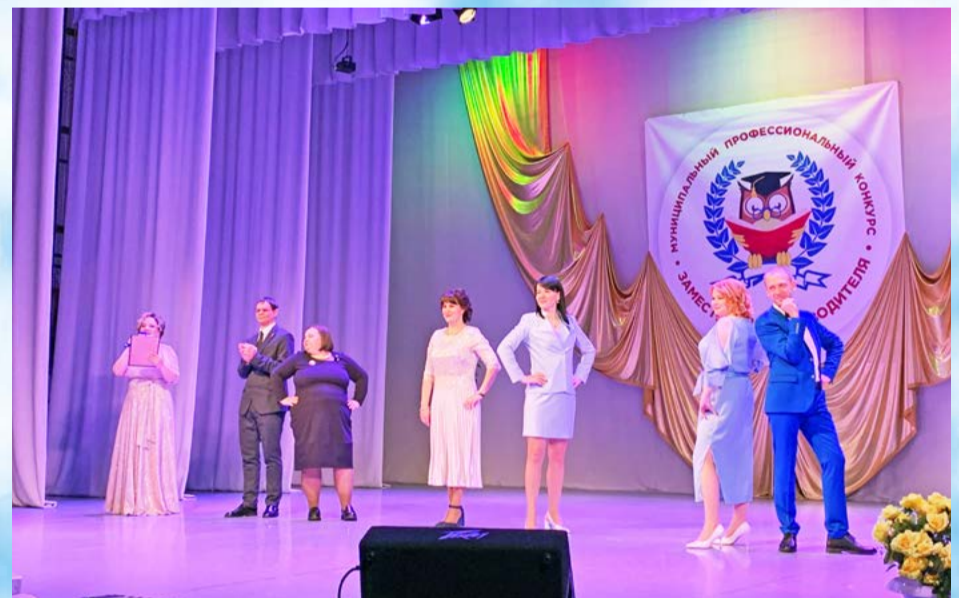
В Магадане подвели итоги второго муниципального профессионального конкурса «Заместитель руководителя образовательной организации» (16+)