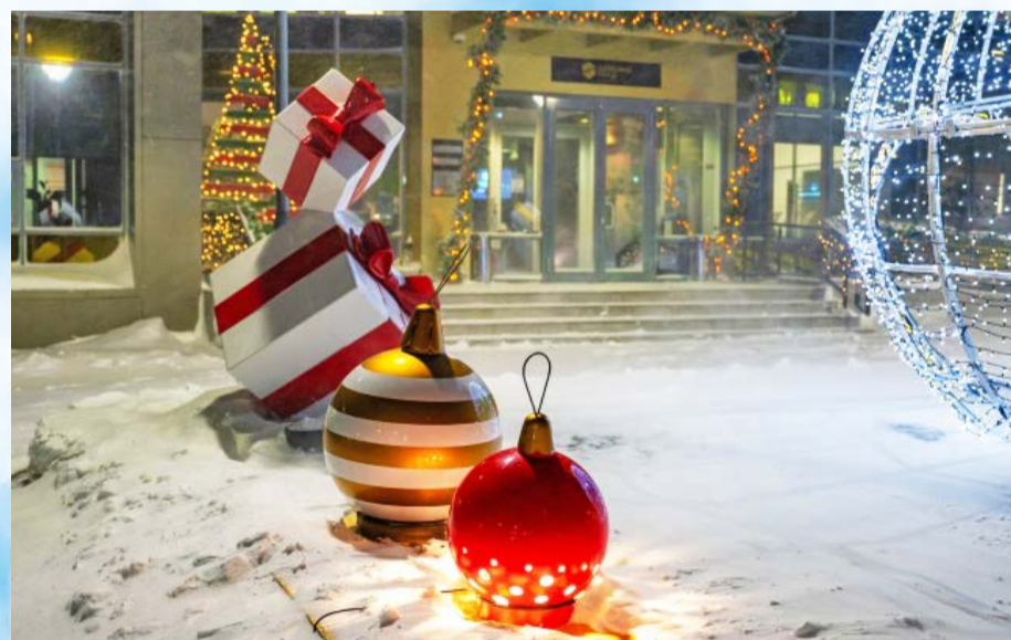
Магаданцев приглашают украсить к Новому году здания и дворы (12+)