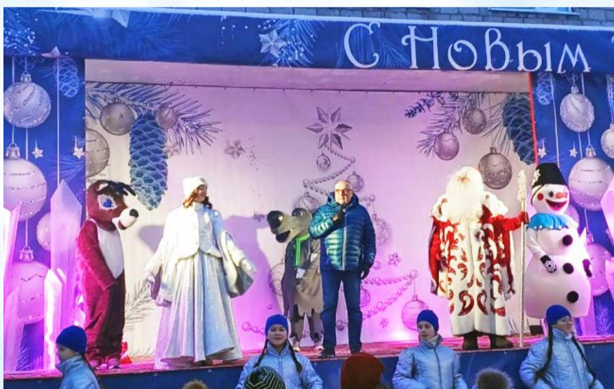
Городская акция «Магадан зажигает новогодние огни» (12+) стартовала в областном центре