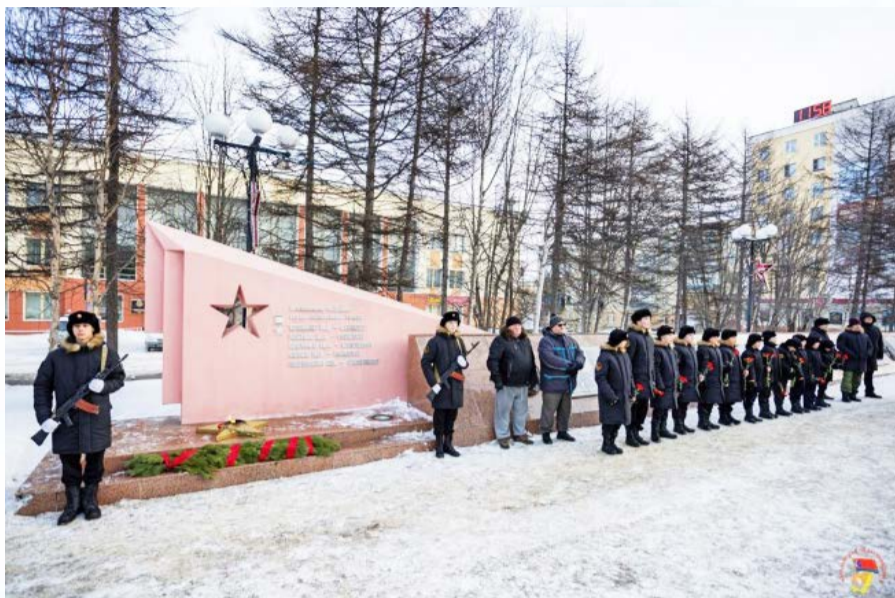
Память Героев Отечества почтили в областном центре