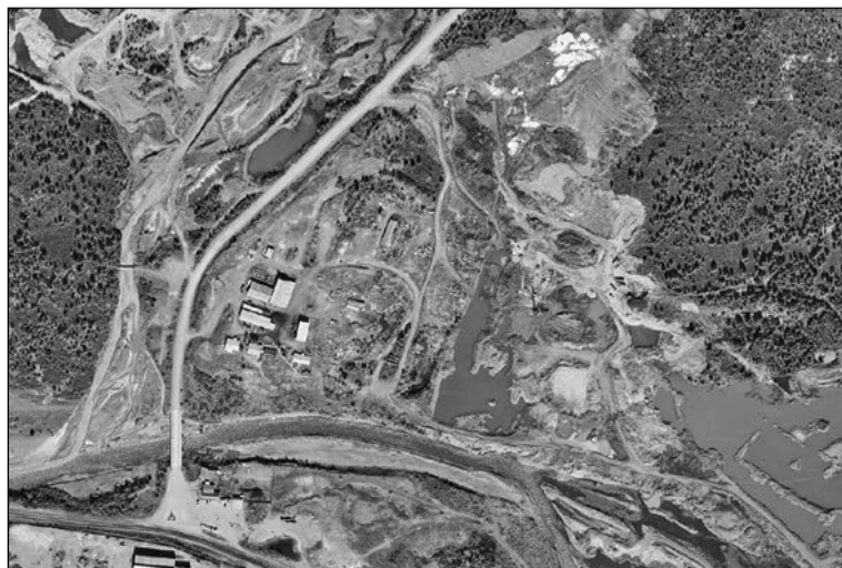
Здесь располагался посёлок Усть-Тажный. Спутниковый снимок. 2024 год

Автор статьи: Василий ОБРАЗЦОВ Оригинал статьи: www.kolymastory.ru