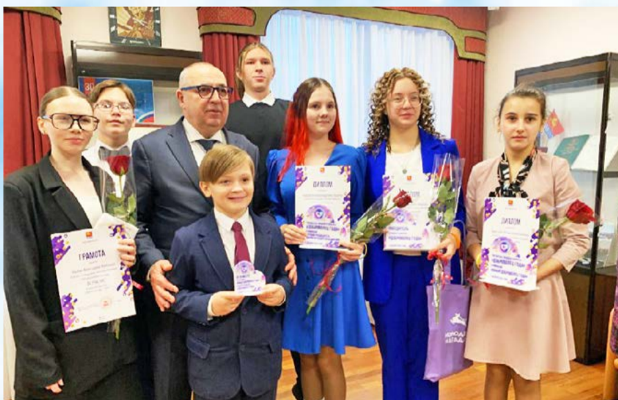
В мэрии Магадана прошло торжественное мероприятие, на котором подвели итоги городского конкурса «Доброволец года - 2024» (12+)