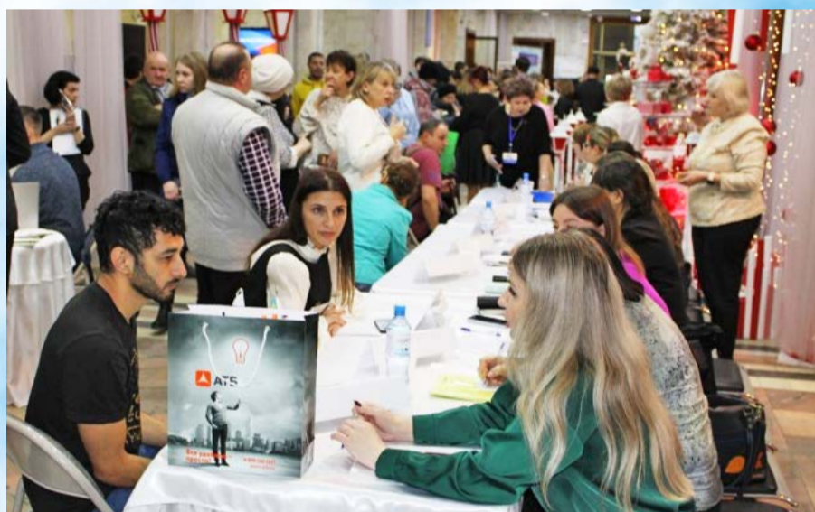
В Магадане прошла 24-я Ярмарка вакансий квотируемых рабочих мест для граждан с ограниченными возможностями здоровья (16+)