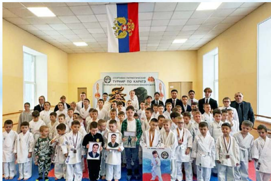
В магаданском ДК «Автотэк» прошел спортивно-патриотический турнир по каратэ WKF «Подвиг ваш бессмертен» (12+)