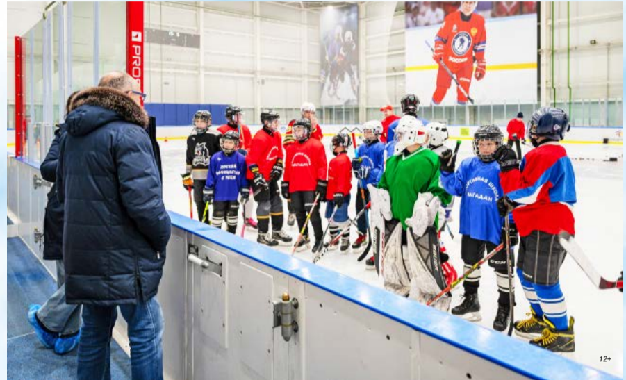
Открытую тренировку по хоккею провели в СК «Президентском» для учащихся магаданской спортшколы № 4