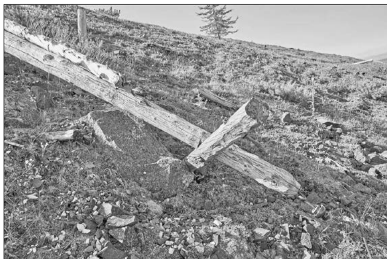
Остатки ЛЭП от электростанции до штолен. Первомайский угольный район. 2020 год.

Автор статьи: Василий Образцов Оригинал статьи: www.kolymastory.ru