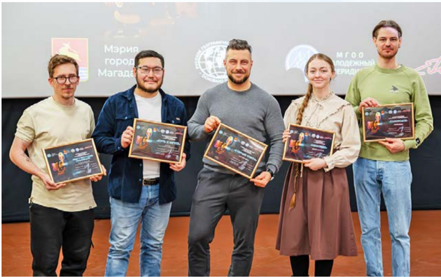
В Магадане подвели итоги конкурса любительского кино (16+)