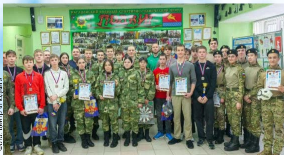
Команда Горного техникума стала победителем в соревнованиях по военно-спортивному многоборью «Магаданские витязи» (16+)