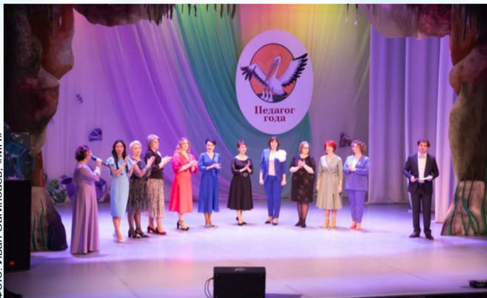
В Магадане стартовал 34-й конкурс профессионального мастерства «Педагог года» (18+)