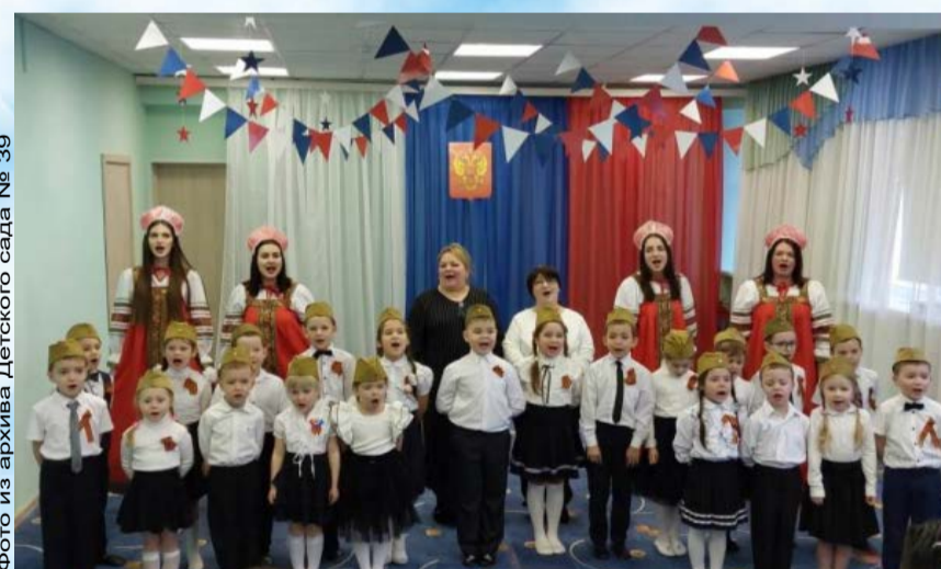
Большой праздничный концерт «За Веру! За Россию! За Победу!» (0+) прошел в магаданском детском саду № 39