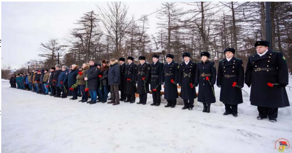
Церемония памяти о россиянах, исполнявших служебный долг за пределами Отечества (16+), прошла в Магадане